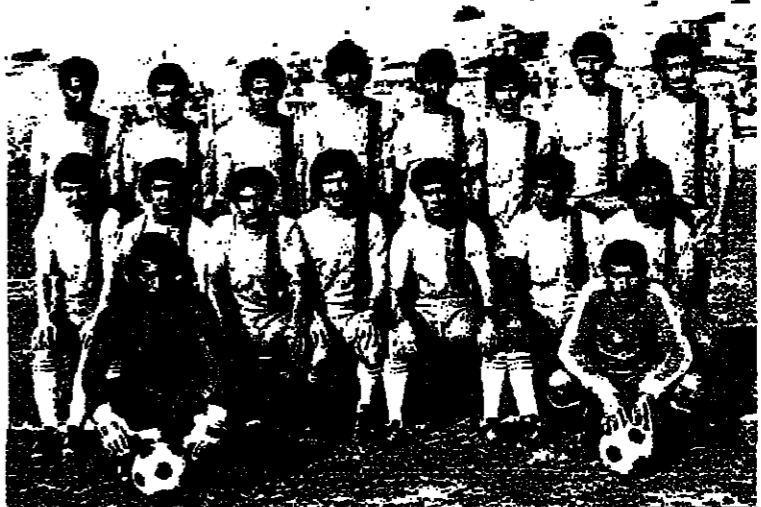
لقاء مكابي ابناء شفا عمرو يوم السبت القادم مع فريق هوبويل تل حنان ضمن الدوري للدرجة الاولى ..